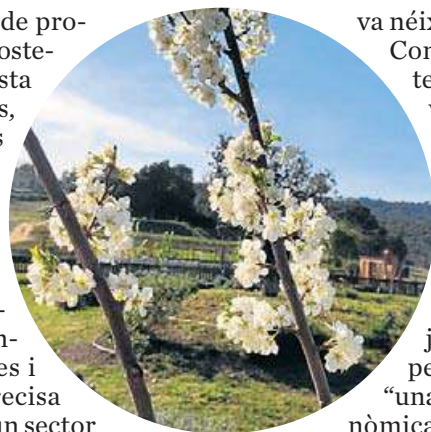
A les fotos, alguns dels espais del parc El Serrat. PARC DE LES OLORS EL SERRAT

La Xarxa de Parcs de les Olors treballa per fomentar un cultiu ecològic i sostenible de plantes aromàtiques, culinàries i medicinals