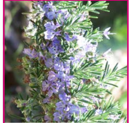
OLI ESSENCIAL DE ROMANÍ Rosmarinus Officinalis