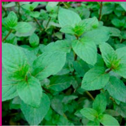
OLI ESSENCIAL DE MENTA Mentha Piperita