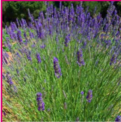
OLI ESSENCIAL DE LAVANDA Lavandula Latifolia

S'utilitza també per alleugerir els dolors musculars, tot fent fregues a la part adolorida i és molt eficaç pel mal de cap. També s'utilitza quan estem refredats com a expectorant, ajuda a respirar millor quan estem molt congestionats.